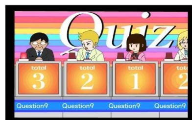
a game show