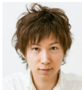
Your new friend Satoshi