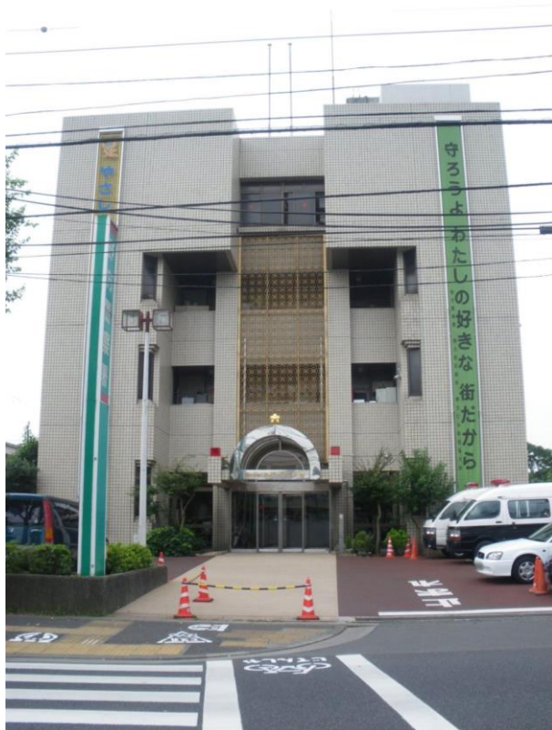
Nogata Police Station

Some believe this case is only the tip of the iceberg . More cheating cases may exist but haven't been discovered yet. Experts are calling for stronger security and better training for staff to protect the fairness of these tests.